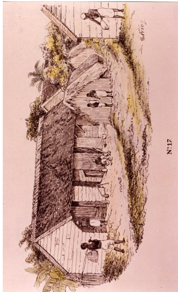
Afbeelding 5: 'Negerhuizen'. Litho, Bray. Stichting Surinaams Museum, collectie Bray, 'Surinaamse schetsen'.